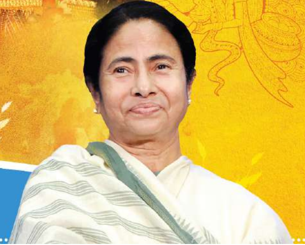
মমতা বন্দ্যোপাধ্যায় মুখ্যমন্ত্রী, পশ্চিমবঙ্গ